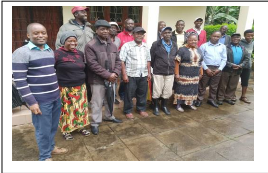
Mitglieder der Genossenschaft Marangu